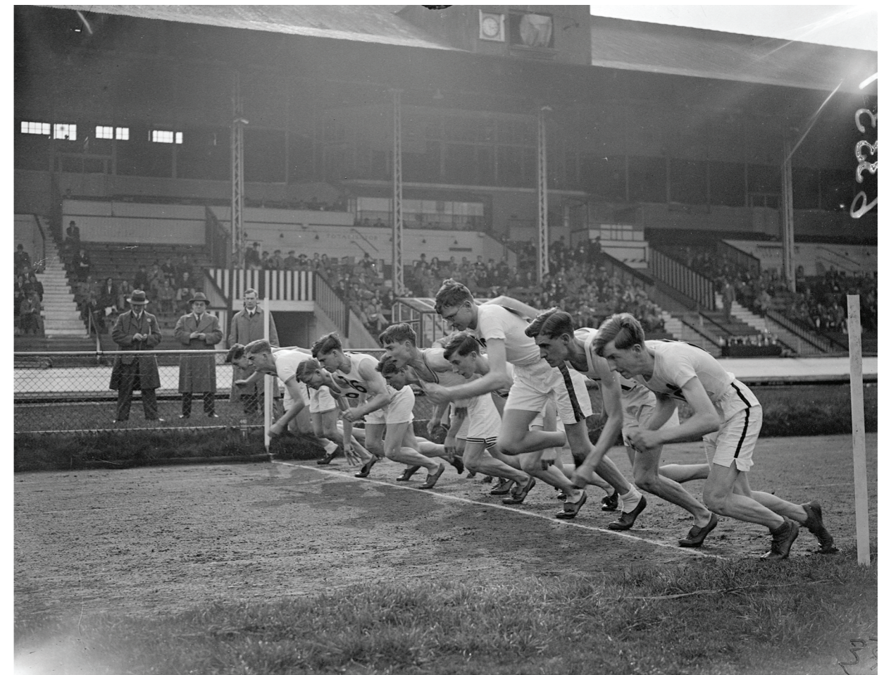
FINALE DE L'ÉCOLE PUBLIQUE, LONDRES

Le sport a une force libératrice - c'est une forme de catharsis. Il est le théâtre d'expressions émotives puissantes éprouvées lors d'une seule compétition.