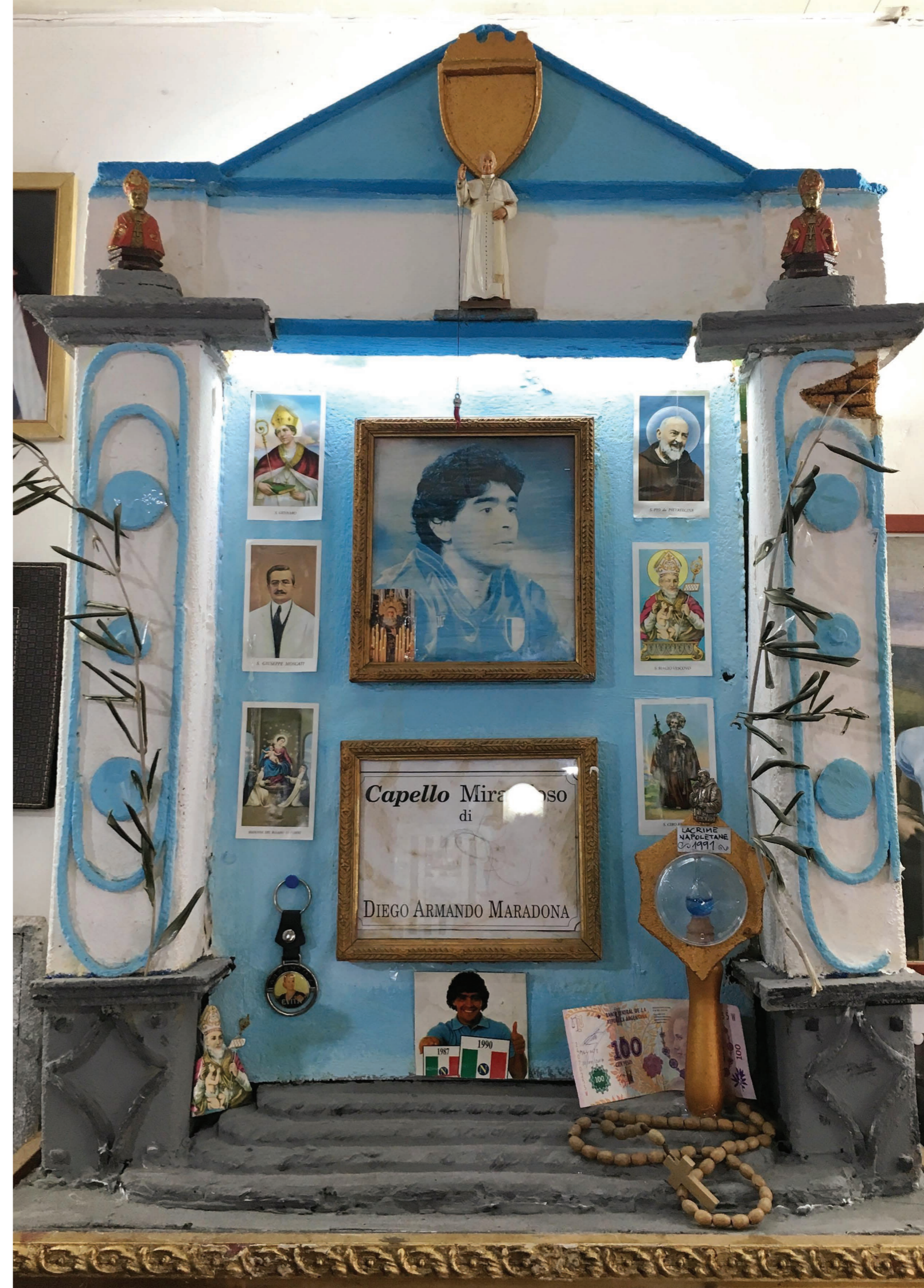
CULTE DE DIEGO MARADONA À NAPLES

Le rêve américain s'applique également au monde du football : on peut sortir de sa fatalité sociale par un talent quasi divin et un entraînement acharné. C'est cette ascension tant de fois témoignée de la banlieue à la victoire de la Coupe du Monde.