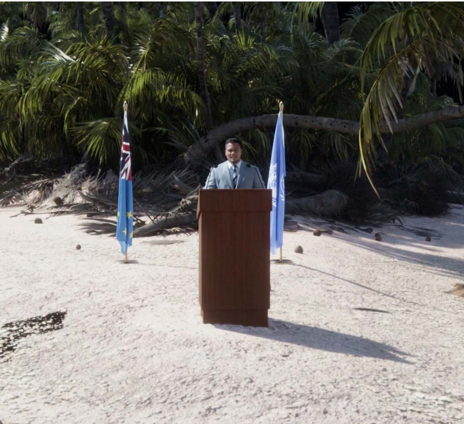
Président de Tuvalu discours COP27 depuis le métavers Capture d'écran

« Notre pays disparaît, et nous voilà contraints de devenir la première nation numérique du monde. » Simon Kofe, ancien ministre des affaires étrangères des Tuvalu.